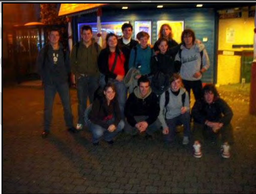
Oceade - 25 nov 2006